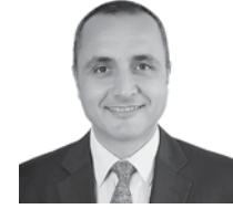
Yağmur Yaşar Rönesans Gayrimenkul