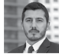
Av. Mesut Kaya