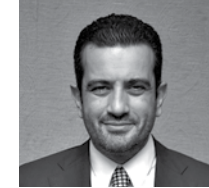
Burak Kutluğ Akdeniz İnşaat