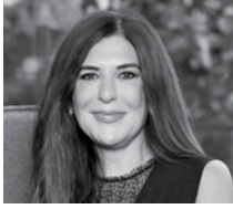
Neşecan Çekici Epos Gayrimenkul