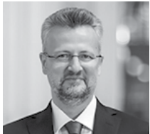
Peyami Ömer Özdilek Ziraat GYO