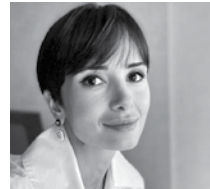
Zeynep Torun Torunlar GYO