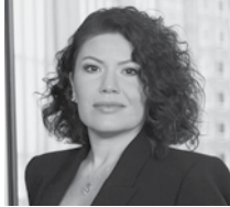
Ece Demirpençe Akfen GYO