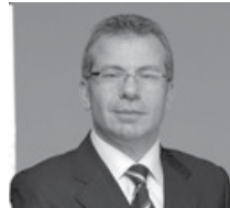
Vedat Aşçı Astaş Gayrimenkul