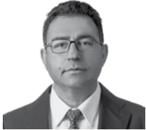
Cengiz Erdem Emlak Konut GYO