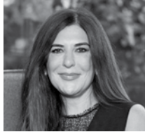
Neşecan Çekici Epos Gayrimenkul