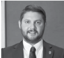
Serhan Çetinsaya Avrupakent Gayrimenkul